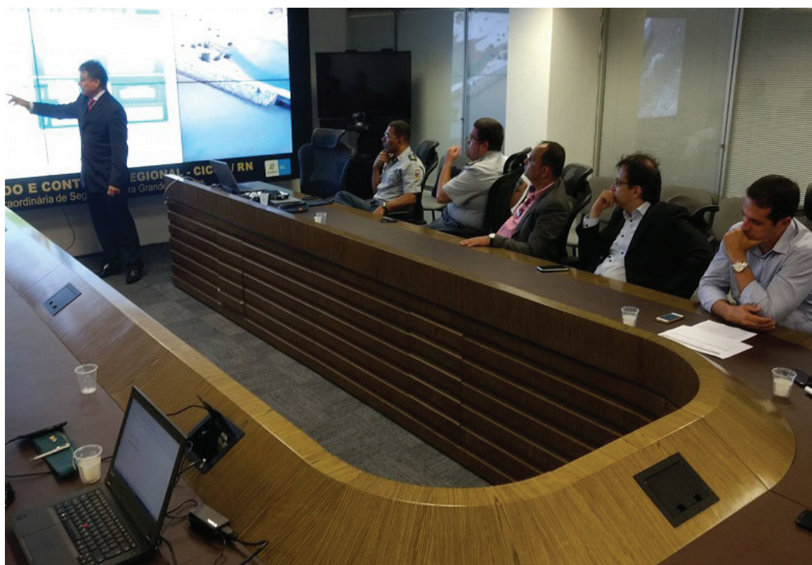
No plano estão ações que visam colaborar com a redução da criminalidade e aumento da segurança, tais como, o fortalecimento da perícia criminal

Nas próximas semanas o Plano Estratégico de Segurança Pública será apresentado ao governador Robinson Faria.