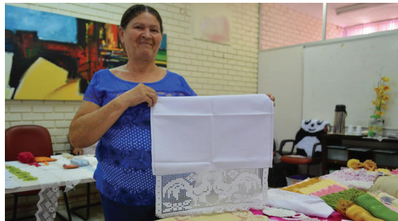
A mostra aconteceu auditório da Sethas-RN e reuniu vários artesanatos

“O objetivo da mostra é articular canais de comercialização dos produtos trabalhados dentro dos empreendimentos de economia solidária. Este é um primeiro momento de uma