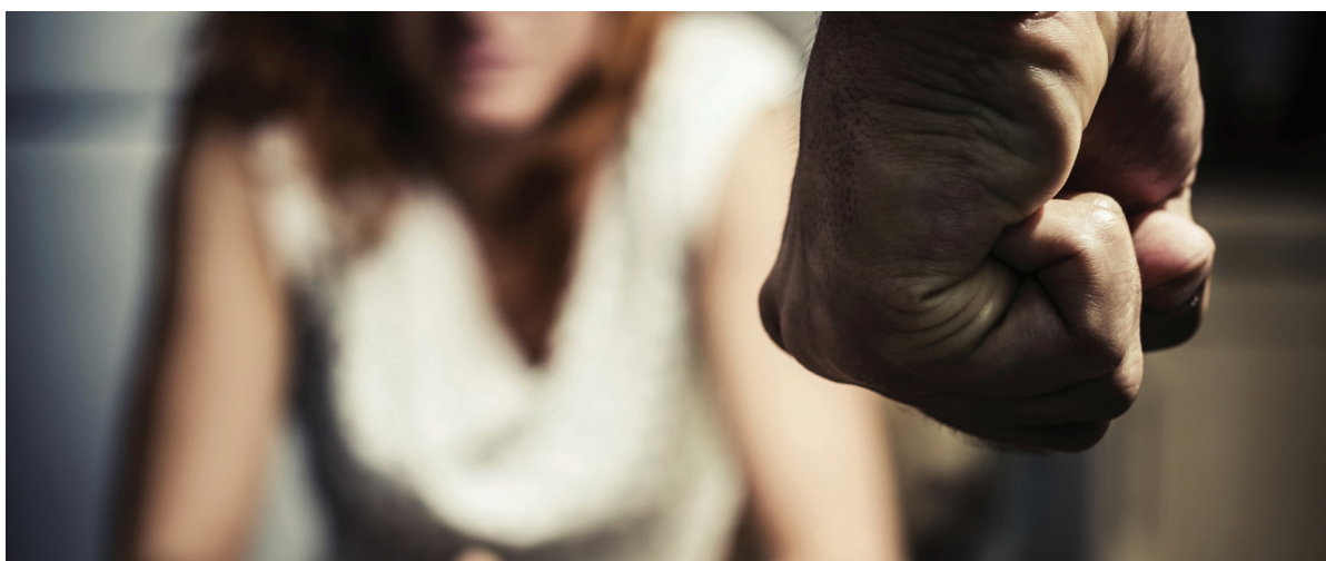
O período da campanha se iniciou no dia 25 de novembro, Dia da Não-Violência Contra a Mulher e se estende até o dia 10 de dezembro, Dia dos Direitos Humanos

Foram desenvolvidas ações em Natal como a Blitz educativa alusiva ao Dia Internacional da Consciência Negra, a Capacitação com os servidores da segurança pública na Escola